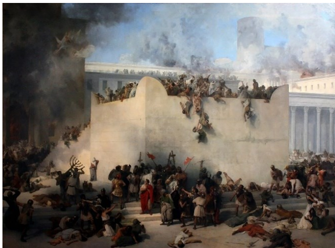
Lucas 21: 5-19: De verwoesting van de tempel van Jeruzalem, Geschilderd door Francesco Hayez (1791-1882),

voorganger ambtsdrager lector organist ontvangst koster kinderkerk beeld en geluid