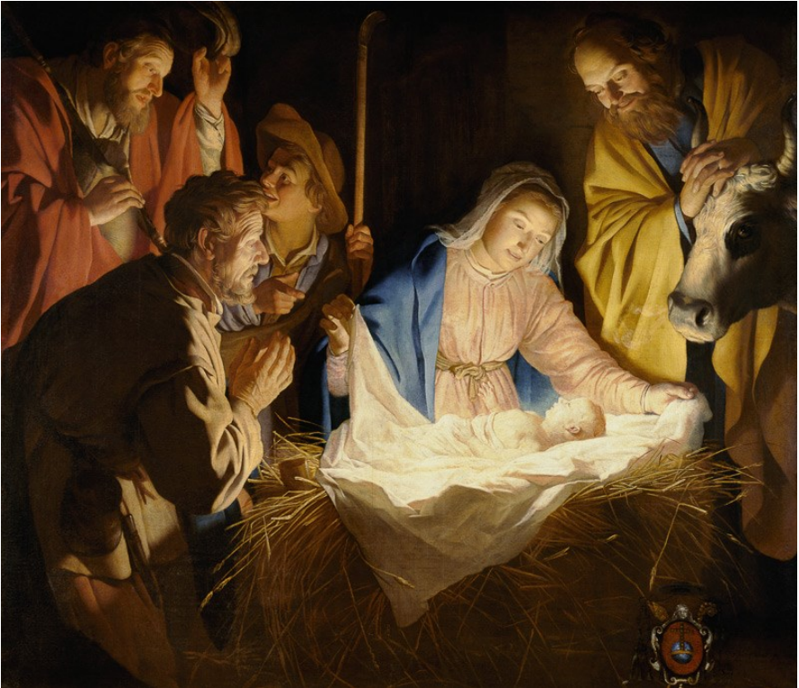
Aanbidding van de herders - Gerrit van Honthorst 1622 - Wallraf-Richartz Museum, Keulen

Orde van dienst Kerstnacht 24 december 2023