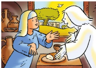
De engel Gabriël komt bij Maria